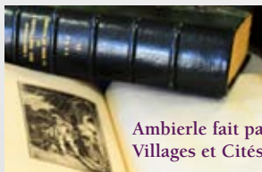
Ambierle fait partie du réseau Villages et Cités du Livre en France.